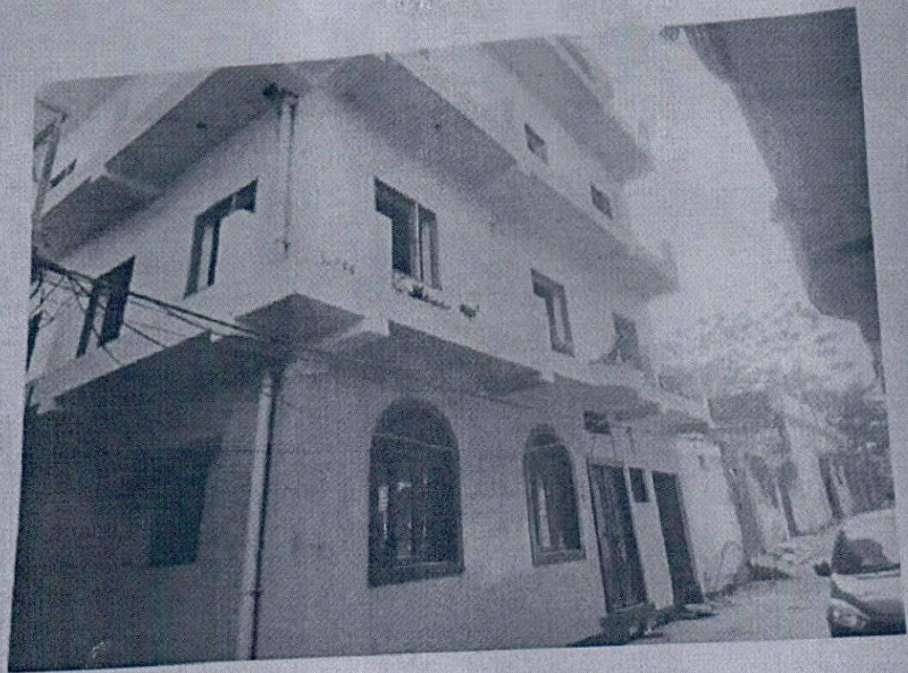
MOLANA AZAZ COLONY ROAD, NO - 11